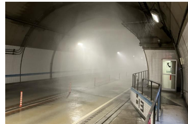
防災設備点検（水噴霧試験）