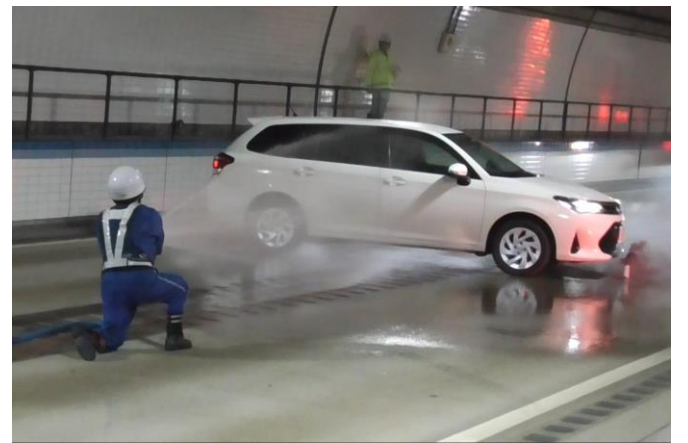
④ パトロール隊（消火栓による初期消火活動）