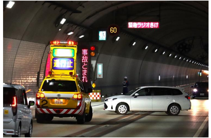
② パトロール隊到着（交通規制）