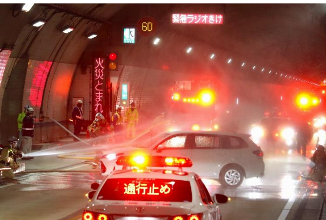
⑤ 箕面消防署消防隊到着（泡消火による消火活動）