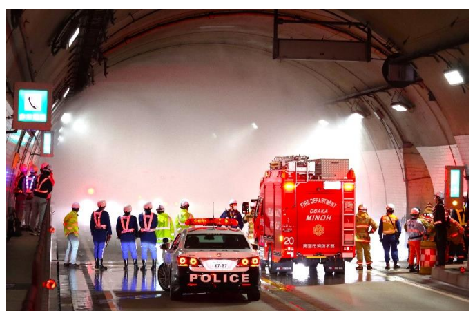
☆トンネル内水噴霧装置実放水体験