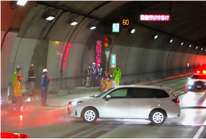
① トンネル内事故発生（火災発生）