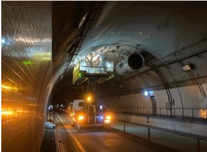
ジェットファン取り付け（工場整備後）

箕面有料道路トンネル点検等のための通行止めは無事終了しました。 ご理解、ご協力いただきありがとうございました！！ 通行止め時間中にこのような作業をさせていただきました。