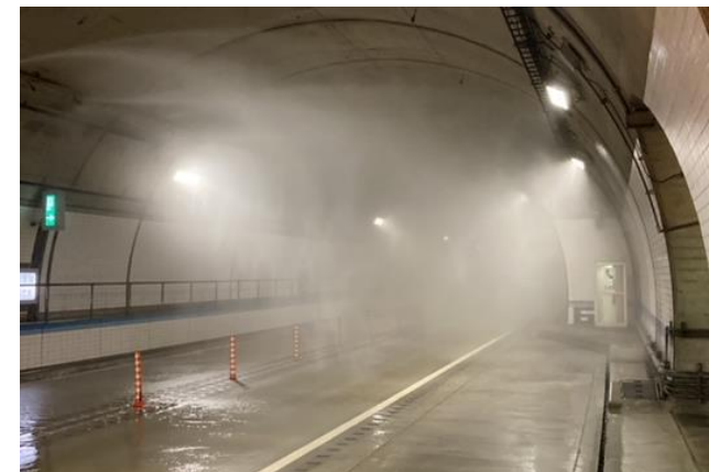
防災設備点検（水噴霧試験）