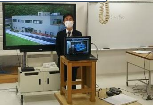
図工室からリモートでの出前授業