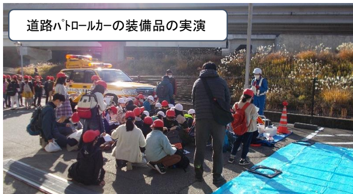
道路パトロールカーの装備品の実演