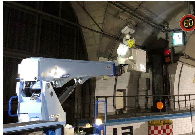
トンネル照明灯交換