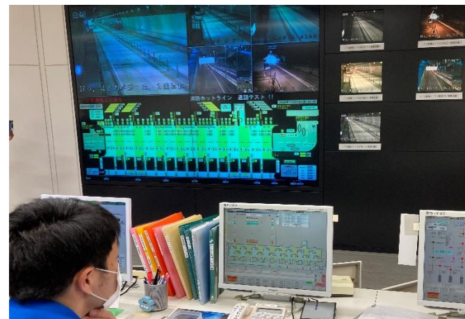
管制システム点検